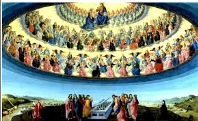
O LUGAR DA MÃE DO CÉU

São três os dias Santos em que se venera Nossa Senhora. Dia Mundial da Paz; Assunção de Nossa Senhora «15 de agosto» e Imaculada Conceição. Peço às famílias de cada um, que, nesses dias, todos participem na Missa, como cristãos.