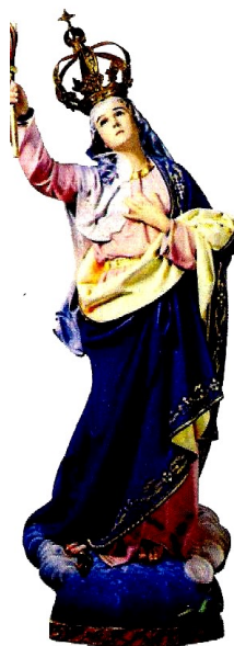
Venerada no Fonte do Facho - Barcelos